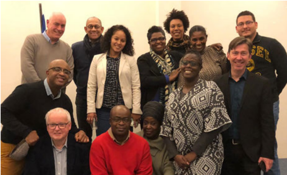
Deel van het huidig (begin 2020) bestuur en vrijwilligers