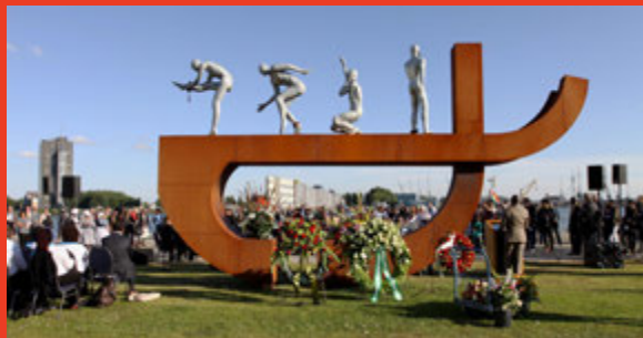
Herdenking 2017