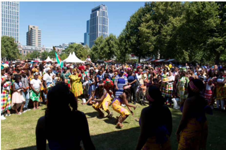
Keti Koti 2018