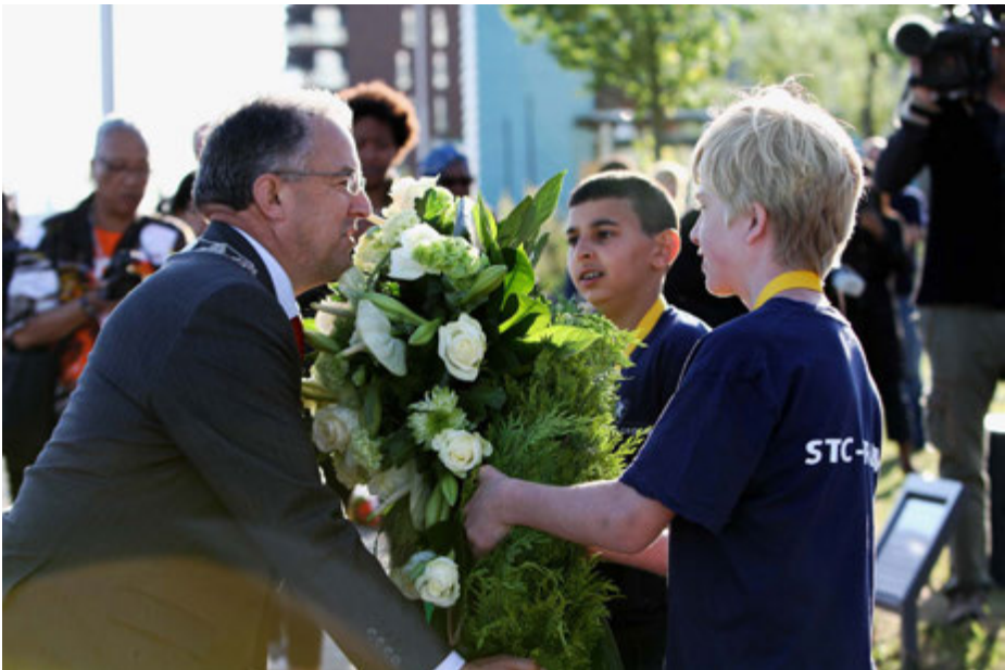
Herdenking 2014