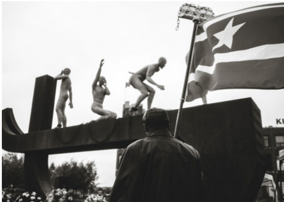
Herdenking 2017