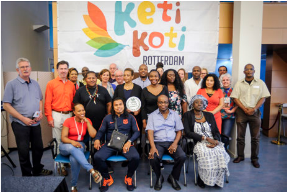
Launch 2019