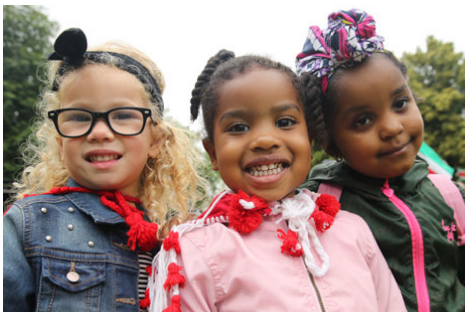
Keti Koti festival 2016

In 2014 ontwikkelden GVGt, KetikotiConnect en Kabra Neti het campagneconcept voor de jaarlijkse Keti Koti herdenking en viering en werd er een huisstijl ontworpen voor alle communicatie-uitingen. In 2018 is er voor het eerst gewerkt met een uitgewerkt communicatieplan en in de komende jaren wordt deze aanpak voortgezet.