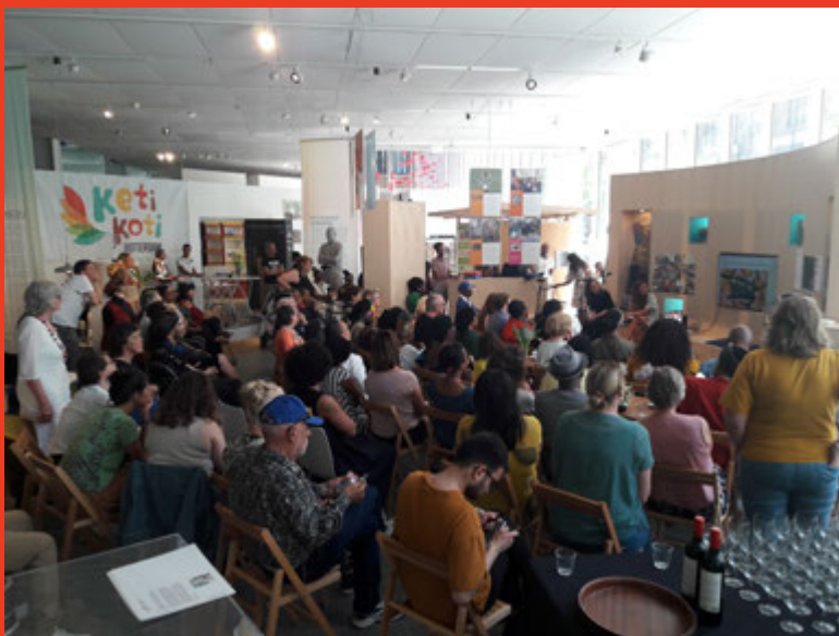
Bijeenkomst juni 2019 in Museum Rotterdam

Wat herdenken we? Waarom herdenken we? Wie herdenken we?