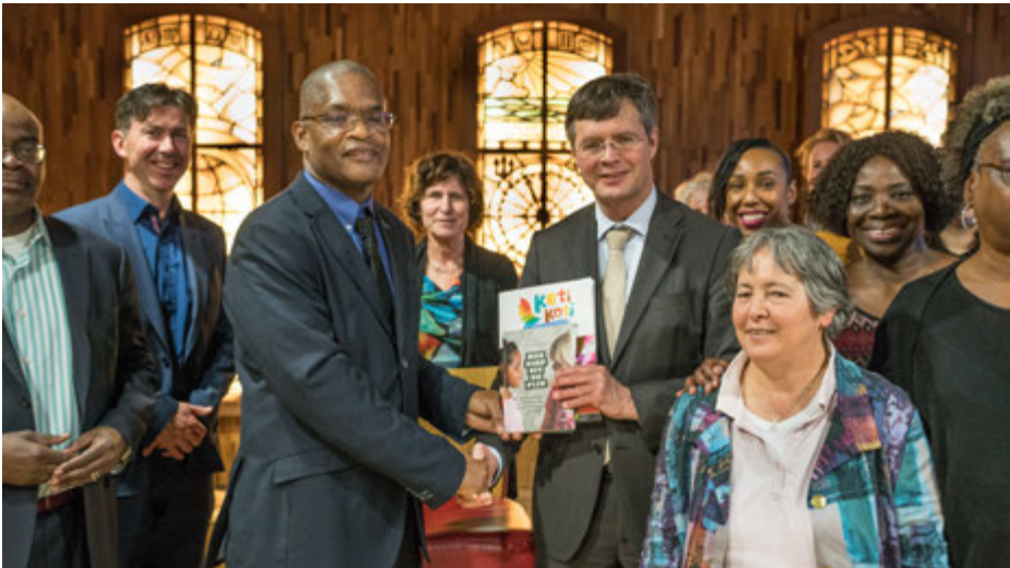
Ontmoeting met Jan Peter Balkenende, 2017